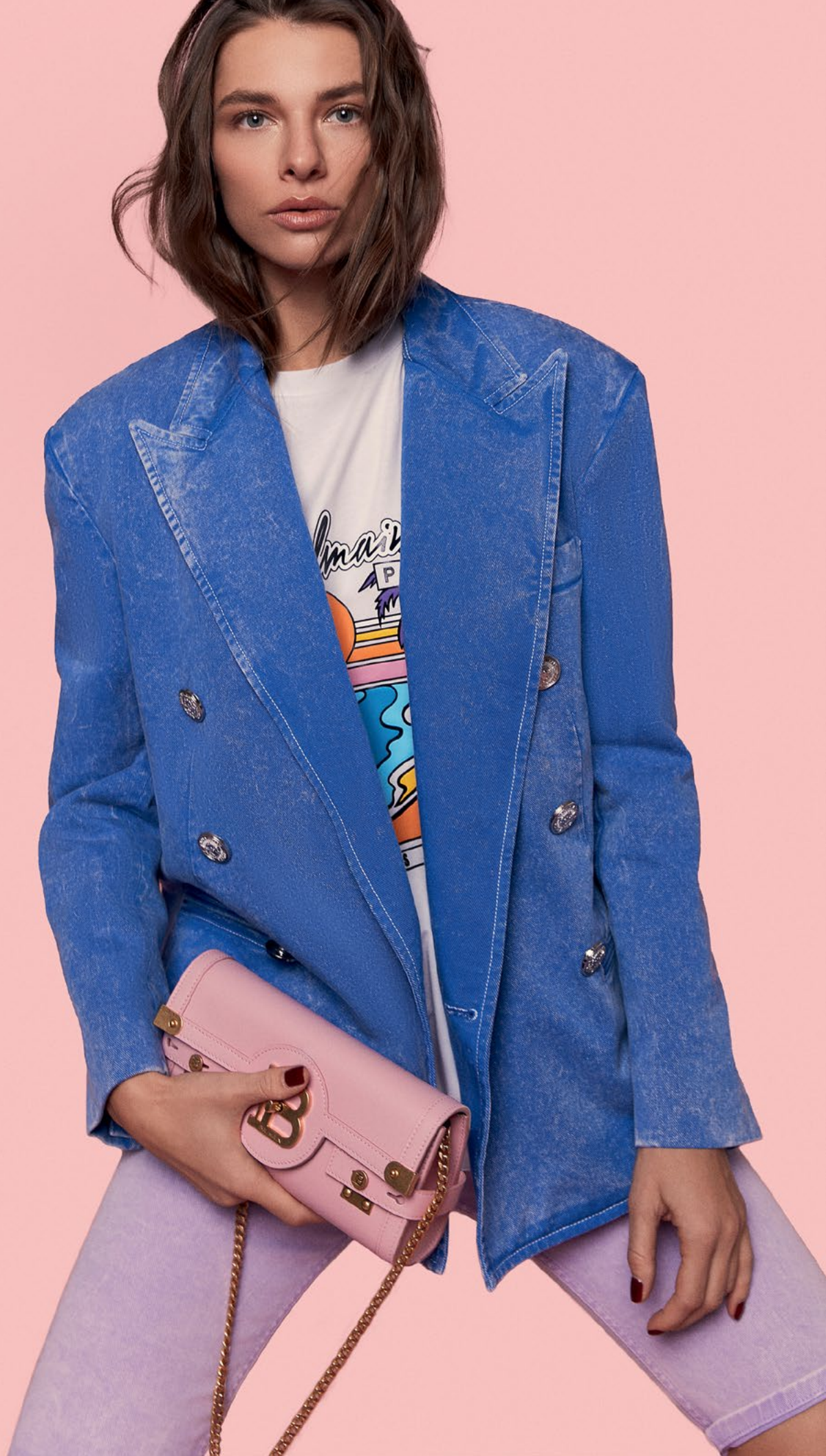
ЖАКЕТ ИЗ ДЕНИМА, ФУТБОЛКА ИЗ ХЛОПКА, ШОРТЫ ИЗ ДЕНИМА, СУМКА И ТУФЛИ ИЗ КОЖИ - BALMAIN.